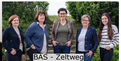
BAS - Zeltweg