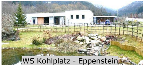
WS Kohlplatz - Eppenstein

Die Lebenshilfe Region Judenburg bietet im Verein sowie in den Einrichtungen der Gemeinnützigen GmbH den Menschen mit besonderen Bedürfnissen eine Vielzahl von Möglichkeiten im Bereich Arbeit und Beschäftigung.