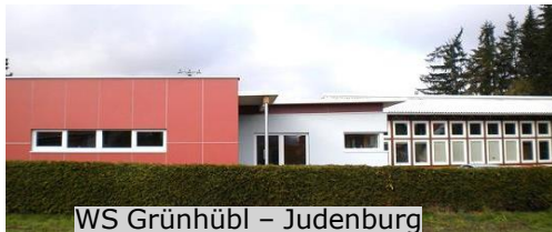
WS Grünhübl - Judenburg