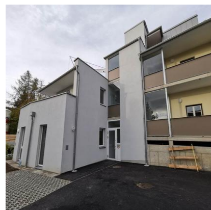
← Wohnhaus neu ELER Haus →