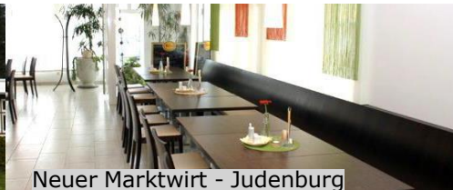
Neuer Marktwirt - Judenburg